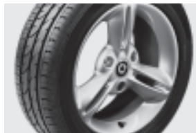
3-Doppelspeichen-Leichtmetallräder 38,1 cm (15") mit Breitreifen vorn: 175/55 R 15; hinten: 195/50 R 15 (R31)