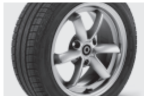
3-Doppelspeichen-Leichtmetallräder 38,1 cm (15") mit Breitreifen vorn: 175/55 R 15; hinten: 195/50 R 15 (R23)