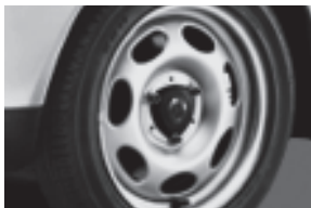
pure Stahlräder 38,1 cm (15") mit Breitreifen vorn: 155/60 R 15; hinten: 175/55 R 15 (R48)