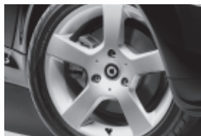
5-Speichen-Leichtmetallräder 40,6 cm (16") mit Breitreifen vorn: 175/50 R 16; hinten: 215/40 R 16 (R19), in Verbin- dung mit smart Sport-Paket (P27)