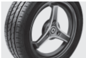
3-Speichen-Leichtmetallräder 38,1 cm (15") mit Breitreifen vorn: 175/55 R 15; hinten: 195/50 R 15 (R30)