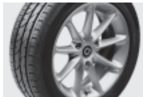
passion 9-Speichen-Leichtmetallräder 38,1 cm (15") mit Breitreifen vorn: 155/60 R 15; hinten: 175/55 R 15 (R25)