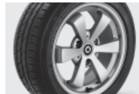
6-Speichen-Leichtmetallräder 38,1 cm (15") mit Breitreifen vorn: 175/55 R 15 hinten: 195/50 R 15 (R67)