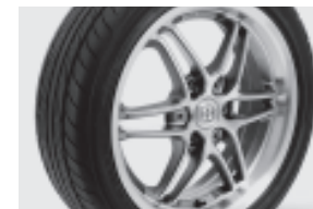
BRABUS „Monoblock VII“-Leichtmetall- räder 40,6 cm/43,2 cm (16"/17") in Silber (R50) mit Breitreifen vorn: 175/50 R 16; hinten: 225/35 R 17 Schwarz glänzend (R76), Grau matt (R77) in Verb. mit BRABUS Sport-Paket (P71)