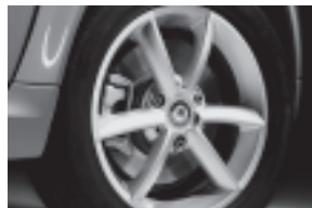
pulse 3-Doppelspeichen-Leichtmetallräder 38,1 cm (15") mit Breitreifen vorn: 175/55 R 15; hinten: 195/50 R 15 (R22)