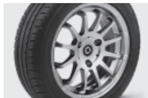
12-Speichen-Leichtmetallräder 38,1 cm (15") mit Breitreifen vorn: 155/60 R 15; hinten: 175/55 R 15 (R24)