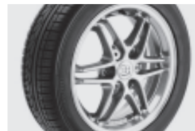
BRABUS „Monoblock VII“-Leichtmetall- räder 38,1 cm (15") in Silber (R61) mit Breitreifen vorn: 155/60 R 15; hinten: 175/55 R 15 Schwarz glänzend (R64), Grau matt (R65)