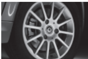
12-Speichen-Leichtmetallräder 38,1 cm (15") mit Breitreifen vorn: 155/60 R 15; hinten: 175/55 R 15 (R72)