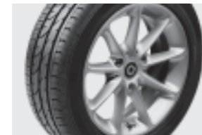
9-Speichen-Leichtmetallräder 38,1 cm (15") mit Breitreifen vorn: 155/60 R 15; hinten: 175/55 R 15 (R25)